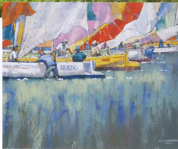
Siddick Nuckcheddy, le Départ . 58 x 70 cm.

C'est sous un ciel somme toute clément, avec un soleil qui dans l'après-midi fit une apparition attendue, que se déroula la journée de peinture en plein air, le lundi 31 mai 2010, dans le cadre du Salon l'Art du pastel en France (lequel eut lieu à Giverny du 29 mai au 6 juin).